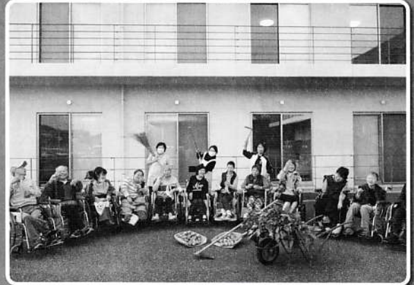
菊池園 プチ畑収穫