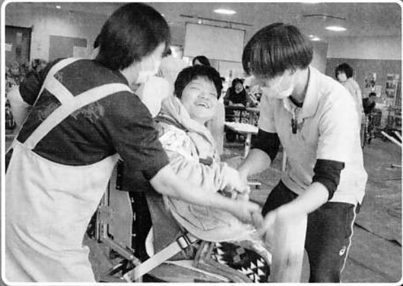
筑前町消防団第7分団との餅つき交流会