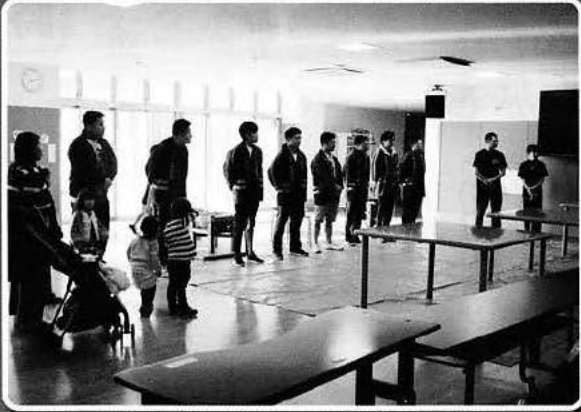
策前町消防団第7分団との餅つき交流会