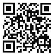
(HP QR コード)

ご心配をおかけすることになり、 心よりお詫び申し上げます。今後 も嘱託医と連携し、感染予防に努 めて参ります。新型コロナウイルス スへの感染状況や 対応についての詳 細は、菊池園ホー ムページにて随時 更新をさせていた だきます。