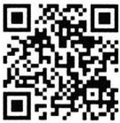
菊池園ホームページ

さて、当施設は施設の建替え (二期工事)完了から、昨年十二 月で十年が経過しました。この十 年で居室の個室化や豪雨対策等、 安全・安心・快適に過ごすための 住環境を整備しました。入所部門 においては、高齢化・重度化への 対応として、日課の見直しや夜間 看護体制を整備し、施設での看取 り支援も行えるようになりました。 在宅部門においては、放課後等デ イサービスや共生型サービスの指 定を受け、子供から六五歳以上の 高齢障害者まで幅広い年齢層への 支援を行えるようになりました。